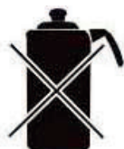
Чайник из алюминия и меди